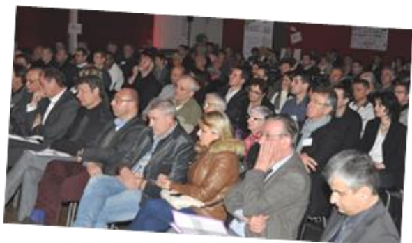
AG 25 mars 2016 à Sanvignes-les-Mines