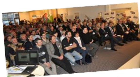
AG 24 mars 2017 à Chalon-Sur-Saône