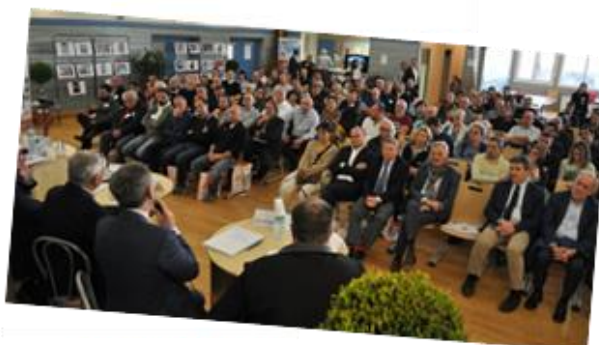
AG 22 mars 2019 à Dracy-le-Fort