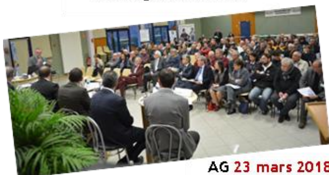
AG 23 mars 2018 à Igé