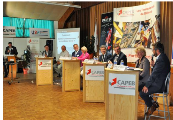
> Assemblée Générale de la CAPEB 71 à Saint-Léger-Lès-Paray (24 septembre 2021)