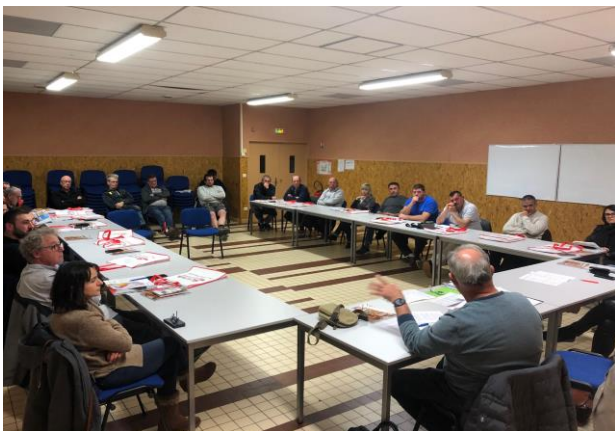
> Réunion terrain avec les adhérents à CLUNY (9 novembre 2021)