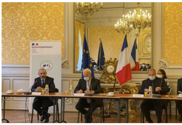
> Rencontre à Mâcon avec M. Alain GRISET , Ministre des PME (2 septembre 2021)