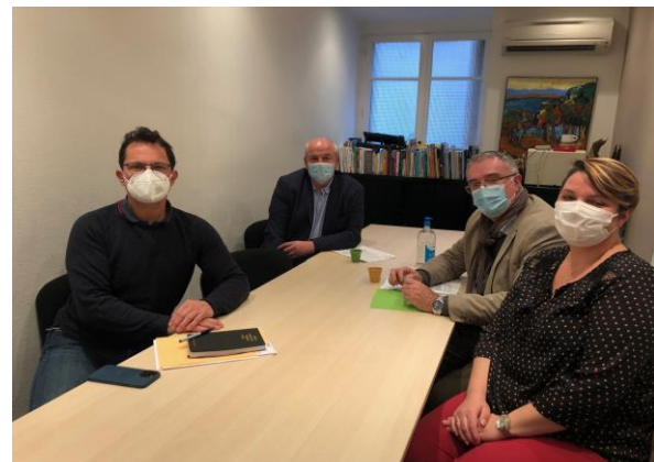
> Rencontre avec le Sénateur Jérôme DURAIN (6 décembre 2021)