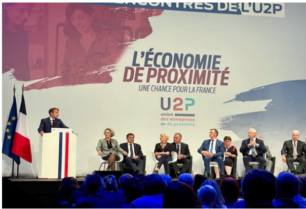
> Rencontre de l'U2P à PARIS avec le Président de la République (16 septembre 2021)