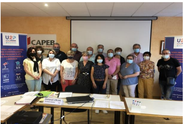
> Réunion des candidats de l'U2P 71 aux élections à la Chambre de Métiers (5 juillet 2021)