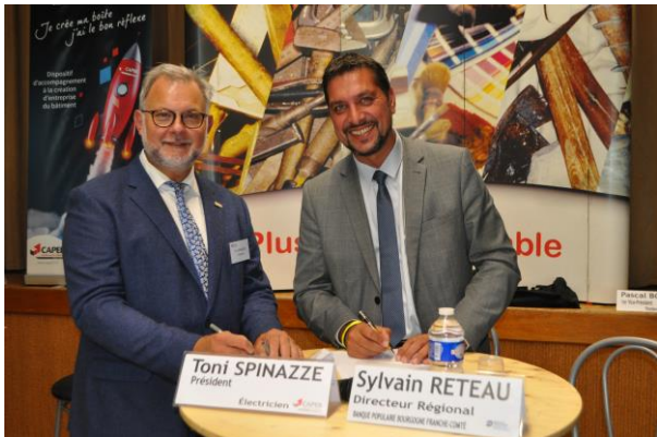
> Signature d'une convention avec la Banque Populaire de Bourgogne Franche-Comté (24/09/2021)