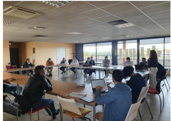
> Présentation des métiers du BTP à PÔLE EMPLOI MÂCON (14 octobre 2021)