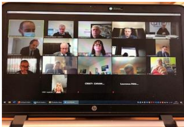
> « Cellule Départementale de Veille Économique » en visio avec le Préfet (3 février 2021)

La CAPEB 71, une organisation professionnelle en mouvement !