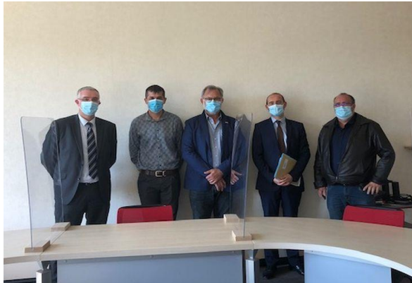
> Rencontre avec M. Julien CHARLES , Préfet de Saône-et-Loire (4 juin 2021)