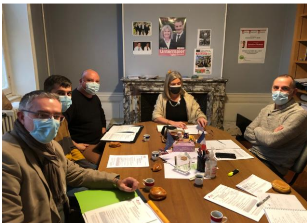
> Rencontre avec la Députée Cécile UNTERMAIER (10 décembre 2021)