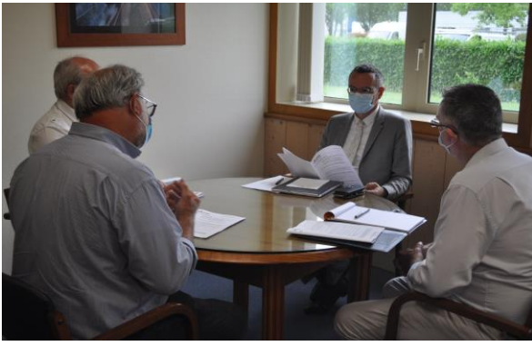
> Rencontre avec M. Olivier TAINURIER , Sous- Préfet de Chalon-Sur-Saône (21 juin 2021)