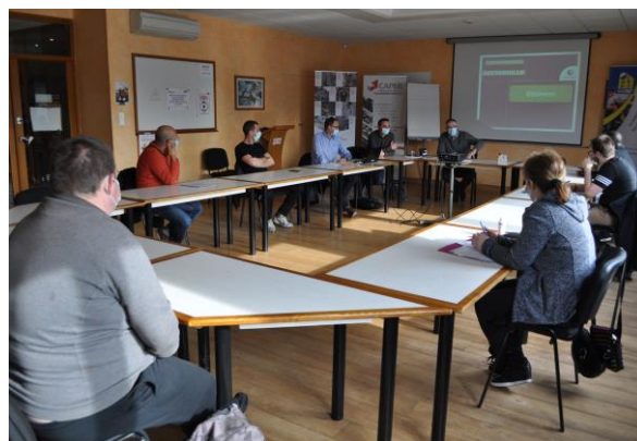
> « Job Dating » avec PÔLE EMPLOI et l'ARIQ BTP à la CAPEB 71 (26 mars 2021)