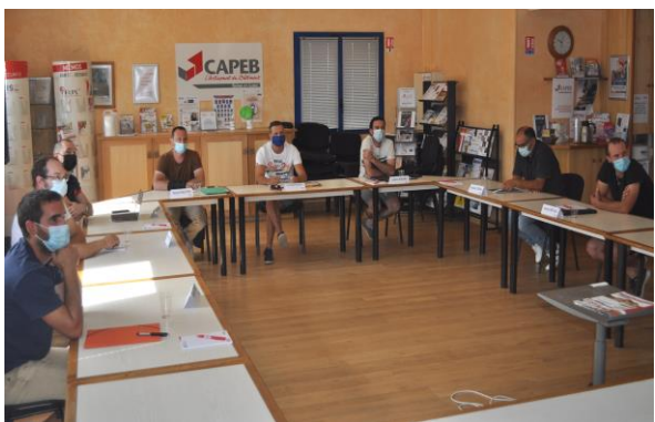
> 1 ère formation « CREARTBAT » à la CAPEB 71 pour les créateurs d'entreprises (21 juin 2021)